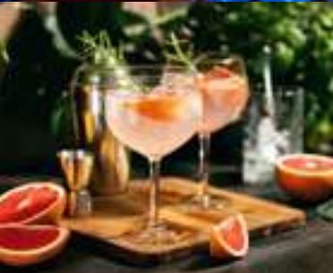
Combinados - Cocktails