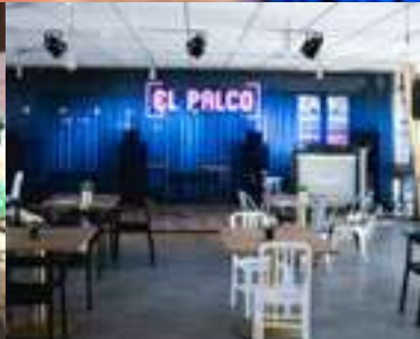
Música en Vivo